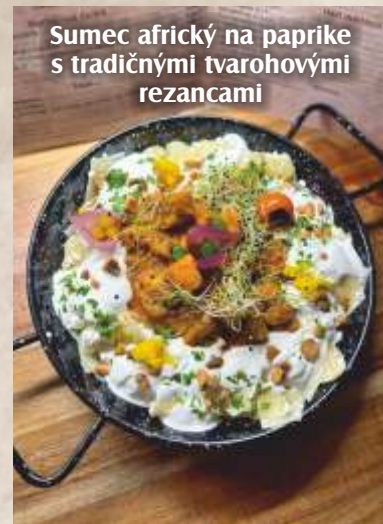
Sumec africký na paprike s tradičnými tvarohovými rezancami

Všetky uvádzané ceny sú konečné, zahŕňajú platnú sadzbu DPH. Cenník je platný od 27.3.2026 do odvolania.