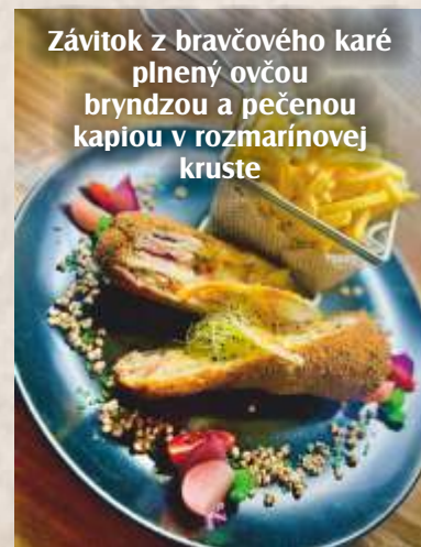
Závitok z bravčového karé plnený ovčou bryndzou a pečenou kapiou v rozmarínovej kruste