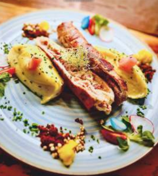
Pečené bravčové karé v chrumkavom bôčiku, plnené farmárskou šunkou a dižónskym chrenovým krémom