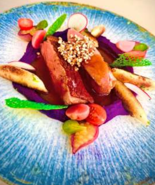
Kačacie prsia Rosé s pyré z červenej kapusty a pomarančovo-tymianovým jus