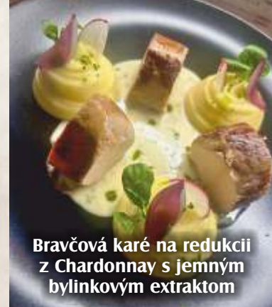
Bravčové karé na redukcií z Chardonnay s jemným bylinkovým extraktom