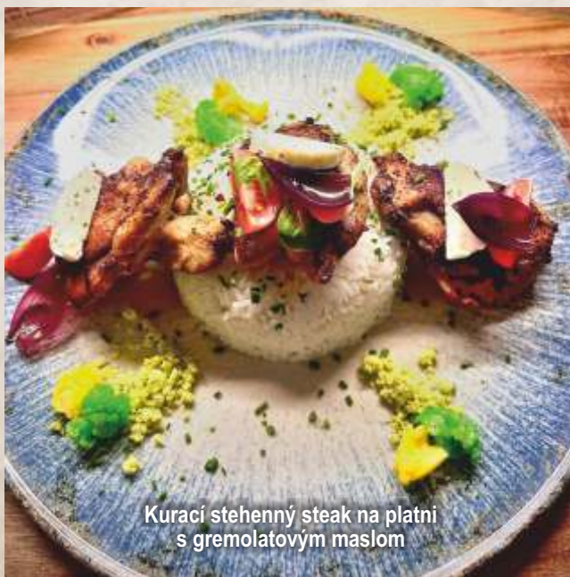
Kurací stehenný steak na platni s gremolatovým maslom